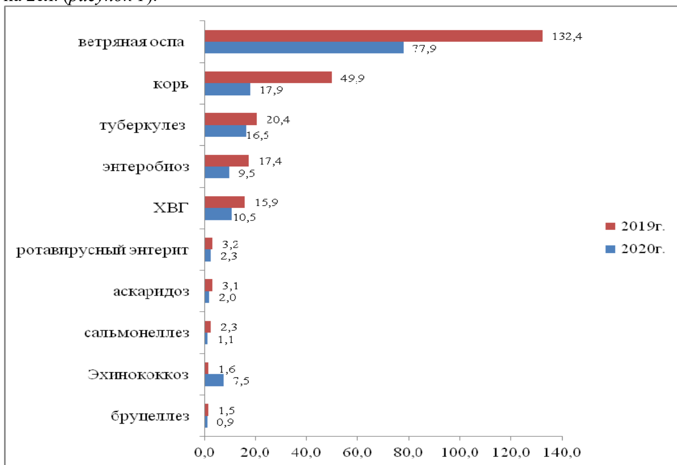
Рисунок 1 – Сравнительная характеристика по инфекционным и паразитарным заболеваниям в Республике Казахстан, по которым отмечается снижение за 5 месяцев 2019, 2020 гг. (показатель на 100 тысяч населения)

В сравнении с аналогичным периодом 2019 года достигнуто снижение заболеваемости по 57 инфекционной и паразитарной нозологии, в том числе: серозным менингитом в 3,9 раз, гнойным менингитом в 3,5 раз, корью в 2,8 раз, сальмонеллезом в 2,1 раз, энтеробиозом – 45,5%, ветряной оспой – 41,1%, бруцеллезом – 38,7%, аскаридозом – 36,5%, дизентерией – 34,3%, шегеллезом – 33,8%, хроническими вирусными гепатитами – 33,7%, ротавирусным энтеритом – 27,2%, туберкулезом – 19,5%, эхинококкозом – 7,5%, менингококковой инфекцией на 2сл. (рисунок 1).