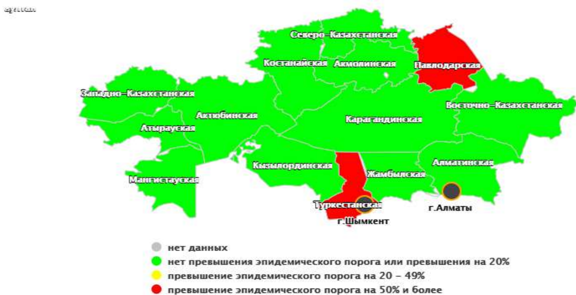
Рис.1 Превышение эпидпорогов заболеваемости за текущую неделю эпидсезона 2020/2021 г.г.

За 40 неделю эпидсезона 2020/2021 гг. в вирусологических лабораториях страны исследовано 11 образцов, положительных не выявлено.